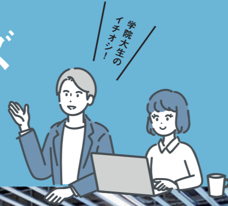
五橋2F オープンスクエア