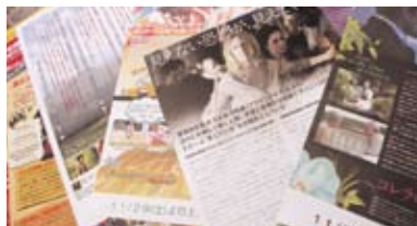
あるレンタルショップでは、貸し出しランキングの上位に名前が載ったこともあるとか。新作のチェックも万全です。