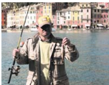
イタリア旅行でのひとコマ。どこへ行くにも釣り竿は欠かせません。