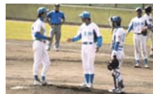
仙台六大学野球での東北福祉大学との一戦。