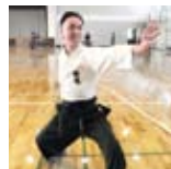
躰道は健康の増進にも最適です。