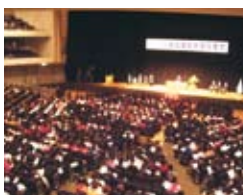
平成19年度卒業式の様子