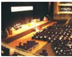
平成20年度入学式の様子