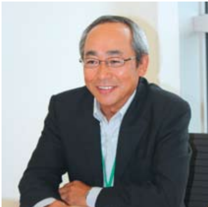
放送会での活動はもちろん、仲間と野球をしたことも忘れられない思い出の一つとか。

自分にとっては身近な大学だったことが、東北学院大学に入学したそもその動機です。高校時代は野球に夢中だったので、入学当初から野球にかかわる仕事につきたいと思っており、それなら放送業界が近道だろうと考えていました。