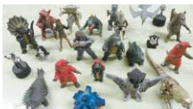
学生からプレゼントされて、いつの間にかいっぱいになってしまったという怪獣の人形。