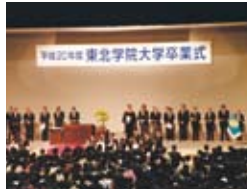
平成20年度の卒業式の様子。