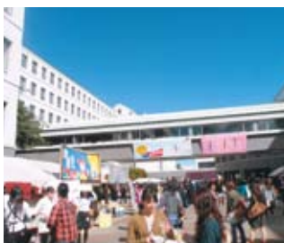
泉キャンパス祭の様子。

会場となった泉、土樋の両キャンパスでは、個性満載の特設ステージや、バラエティー豊かな出店、各教室での展示・発表など、各サークル・団体が自分たちの個性を咲かせました。16日(金)には、仙台市中心部のアーケード街で、華やかな仮装パレードも繰り広げられました。