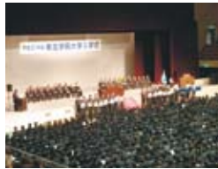
平成21年度入学式の様子。