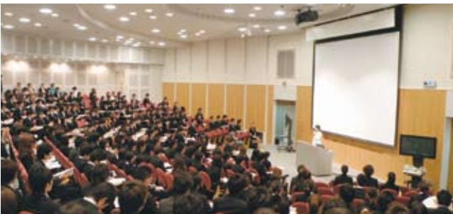
事前研修会の様子。

実際の職場で仕事を体験するインターンシップ。7月13日(月)には事前研修会が行われ、リクルートスーツに身を包んだ3年生が、社会人としてのマナーや知識、正しいお辞儀の仕方などを学びました。7月21日(火)はホテルで受け入れ事業所との顔合わせ会も行われました。インターンシップが終わると、10月23日(金)には体験報告会が行われました。