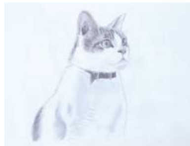
愛猫の絵。リアルな鉛筆画が印象的です。