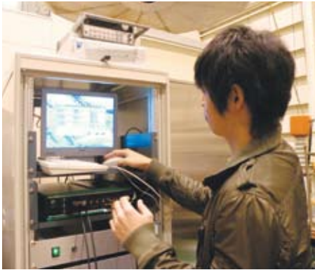
新型センサの研究開発には、工学部の学生もメンバーに加わっています。