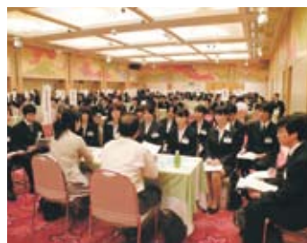
受け入れ事業所との顔合わせ会の様子。

夏休みを利用してインターンシップに参加した3年生は246名。本格的な就職活動に向けて、ぜひその体験を活かしてください。