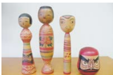
こけしの本一本に、工人たちの生き様が映し出されています。