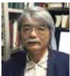
歴史学者、 東京大学名誉教授 ほたて みちひさ 保立 道久氏