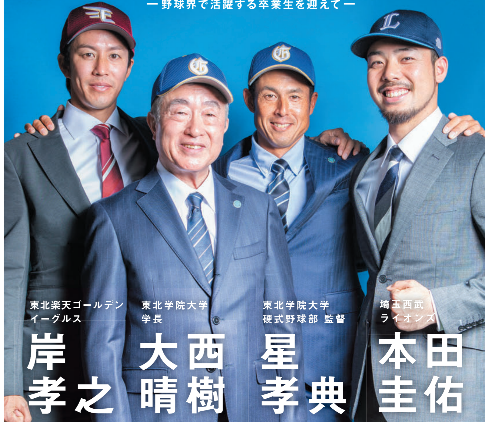
東北楽天ゴールデンイーグルス 岸孝之