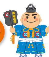
青森県産品 PRキャラクター 決め手くん