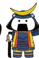
仙台・宮城観光 PRキャラクター むすび丸