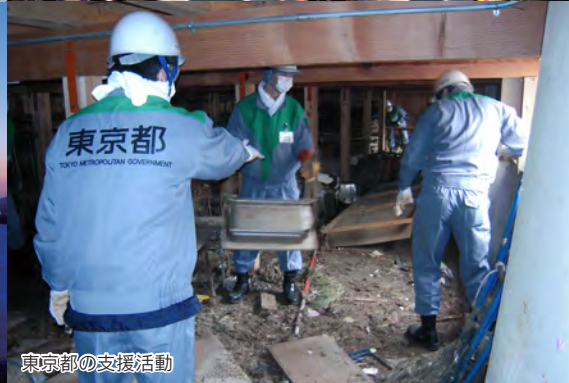
東京都の支援活動