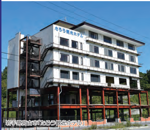
岩手県宮古市「たろう観光ホテル」