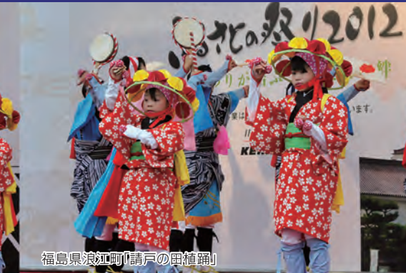
福島県浪江町「請戸の田植踊」