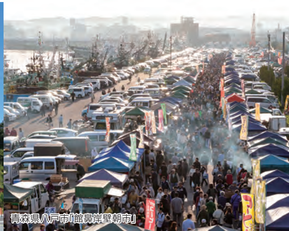
青森県八戸市「館鼻岸朝市」