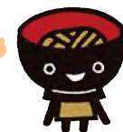
岩手県 PRキャラクター わんこきょうだい そばっち