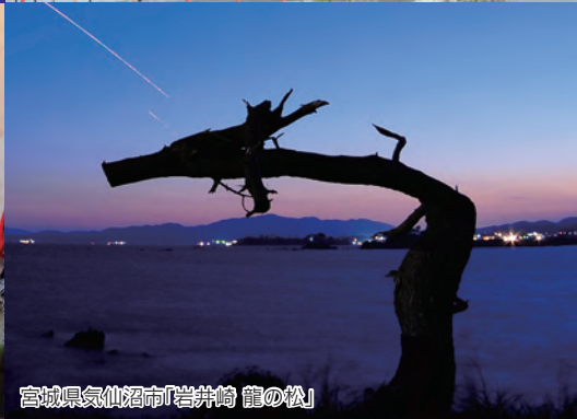
宮城県気仙沼市「岩井崎 龍の松」