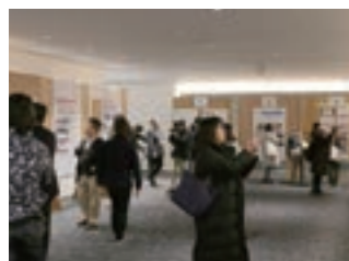
平成29年 大学間連携災害ボランティアシンポジウム

本学は、宮城県の学生が積極的に関われるボランティアネットワークの代表大学でもあります。復興へ関わる気づき・きっかけの場として、様々な機会をセッティングしています。