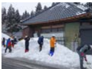
平成29年2月 山形県豪雪地帯除雪ボランティア活動