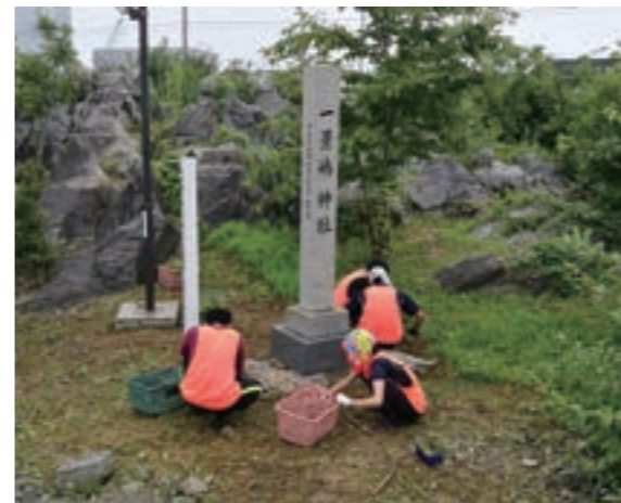
平成29年8月夏ボラ気仙沼プロジェクト活動2