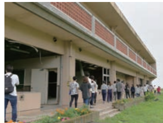
平成29年8月夏ボラ亘理郡山元町プロジェクト活動