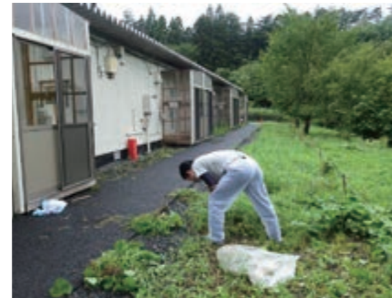
平成29年8月夏ボラ気仙沼プロジェクト活動