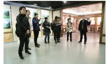
中国・重慶市武隆博物館で資料調査