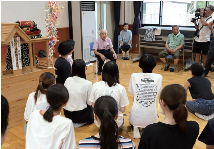
民俗芸能を習い、知り、研究する(福島県南津島の田植踊・神楽)