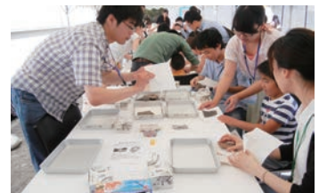
大学博物館でワークショップを開催