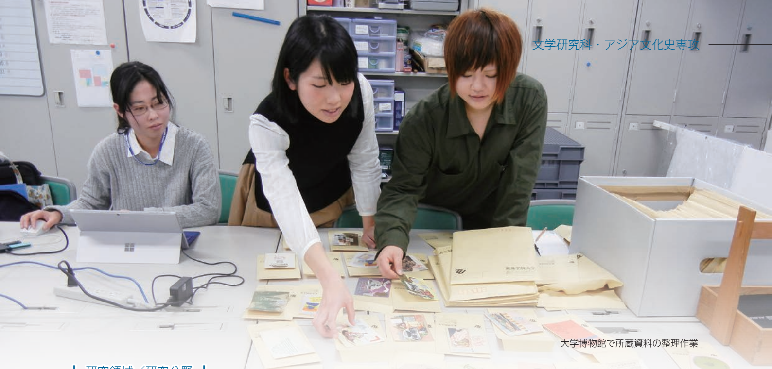
大学博物館で所蔵資料の整理作業