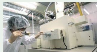
電子ビームリソグラフィー（研究棟に設置されている装置の一つ）

空間情報の利活用を目的として、空間的可視化による地域防災支援などの様々な分野での応用研究