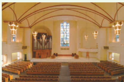
泉キャンパス礼拝堂