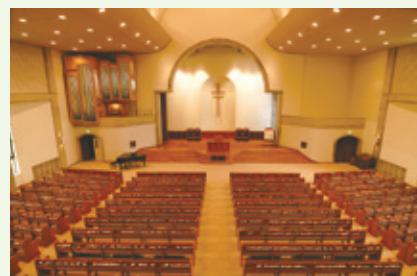
多賀城キャンパス礼拝堂