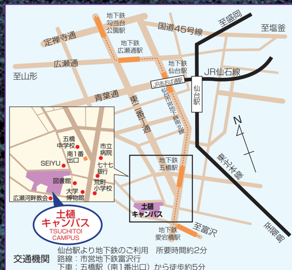
東北学院大学土樋キャンパス案内図