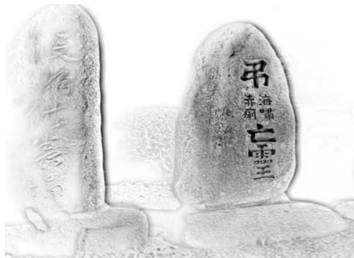
陸前高田市小友華蔵寺の海嘯・ 赤痢供養碑