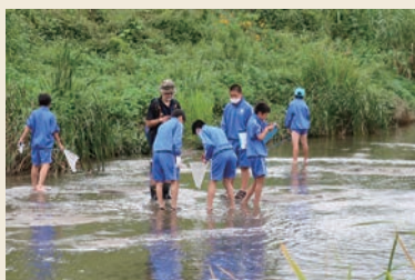
中1学年が「3L希望学」で「河川調査」