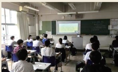
東北学院大学の先生方による オンライン講義を受講