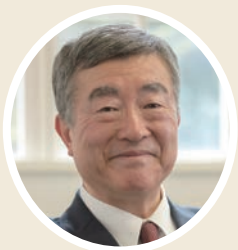
宗教センター所長 東北学院院長・学長