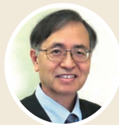
宗教センター主任 大学宗教部長

そこで、今年のクリスマスは、お父さんやお母さんへ、また友だちや身近な人たちに何かプレゼントをしませんか。自粛で、つらいことの多い年ですから、気持ちでも、メッセージでも、品物でも、お菓子でもなんでもいいのです。「イエス様がわたしのところに来てくださったので、わたしもあなたにプレゼントします」と心に留めながら。与えることは受けることより幸いであると聖書も語っています（使徒20:35）。