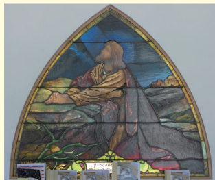
作者不詳 Trinity United Church of Christ East Petersburgにて 2018/8/5撮影