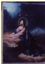
山下りん 制作年不詳(1910年前後?) 鹿沼正教会1998/7/5撮影