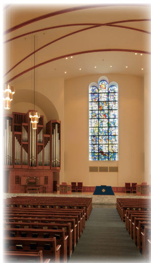
泉キャンパス礼拝堂