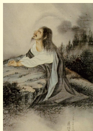
下岡蓮杖 1899年制作 (部分)

ホフマンの『ゲッセマネのキリスト』の続きです。1890年に描かれて以来、人気の絵画でした。早くも 1899年に日本画で模写している下岡蓮杖 (1823-1914)は長老派のプロテスタント、「イエス・キリスト (IC XC)」との銘文をつけてアイコン (聖像) にしている山下りん (1857-1939)は正教会つまりロシアからのキ リスト教、そしてアメリカの合同派のステンドグラスもあります。画材も紙、キャンバス、そしてガラスと様々 です。この神さまの人間的な苦しみは、イザヤ書の「苦難の僕」であり、また「神の痛みの神学」で、キリ スト教の宗派を超えるだけでなく、和辻哲郎も『埋もれた日本』の中で書いているように、室町時代の「説 経師」のお話にも見られる広く神話的な表象でもありました。 (文学部 鐮木 道剛)