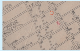
○印が創立の場所 (木町通北六番丁角)