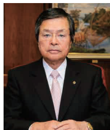
東北学院大学後援会 会長