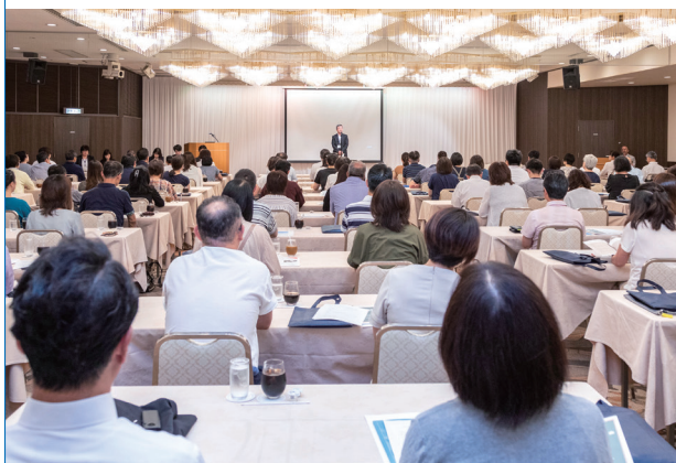
2019年開催時の写真です。今年は会場内感染症対策を行い開催いたします。

開催時間 午前開催 10:00～13:00 午後開催 13:00～16:00 仙台地区のみ9:20～13:00開催