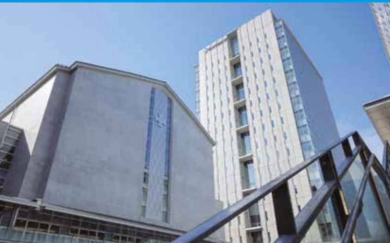
[左:押川記念館・右:シュネーダー記念館]