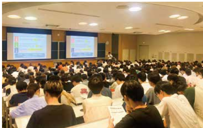
6月に学内で開催の「TGインターンシップ&業界研究フェア」の様子