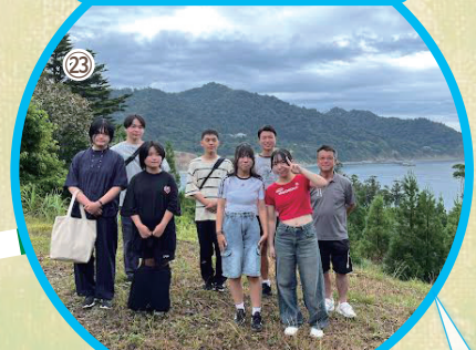
仲間と学び、祈った2日間! 1マスすすむ