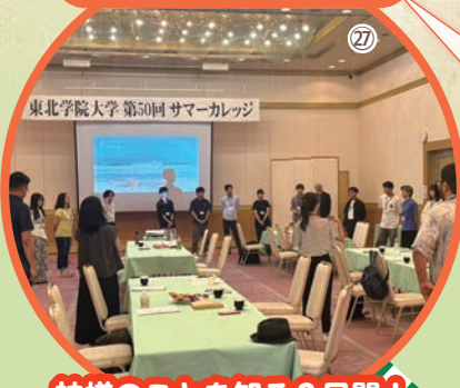
神様のことを知る2日間! ゴールへジャンプ!