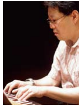
うえお なおき 上尾 直毅

スウェーデン出身。近年、リコーダーの巨匠ダン・ラウリンは世界各国で演奏活動を展開してきた。アメリカ、日本、オーストラリアを始めヨーロッパ各地でのツアーは高い評価を得ている。リコーダーの可能性を再発見するための彼の努力は彼の革新した技術や表現方法などでグラミー賞や様々な賞を受賞することになった。彼のスウェーデン現代音楽の解釈ではスウェーデンの作曲家ソサエティから最優秀賞を得、2011年にもスウェーデン王立アカデミーからその解釈に対する賞を得ている。オーストラリアの楽器製作者フレドリック・モーガンとの長期にわたるコラボレーションでは初期のリコーダーの復元を数々行い、その結果としてリコーダーの世界を深く豊かなものにした。また管楽器楽曲の最高峰と言われているヤコブ・ファン・エイク作曲のDer Fluyten Lust-hofの収録にはラウリンの為に製作された楽器が使用された。中世期の音楽演奏活動以外に、ラウリンはスウェーデン作曲家の楽曲の初演も数々行っている。リコーダーのレパートリーの拡大と、他の楽器と同等にオーケストラとの共演するソロ楽器としての地位の獲得に貢献し、その結果協奏曲も数々作曲され、すでに名作とよばれる曲も少なくはない。現在ラウリンはストックホルム王立音楽大学の教授、ならびにスウェーデン音楽院のメンバーでもある。2001年にはスウェーデン国王より権威ある勲章Litteries et Artibusを授与された。