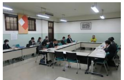
▲第7回共同キャリア支援部会