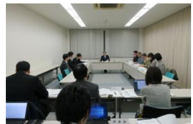
▲第5回教育プログラム開発部会