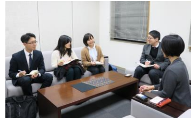
▲企業インタビューの様子

※事業の取り組みは「地域協働教育推進機構Webサイト」（URL http://miyagi-coc.jp/ ）で紹介しています。