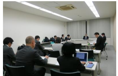
▲第4回地域協働教育推進機構運営会議