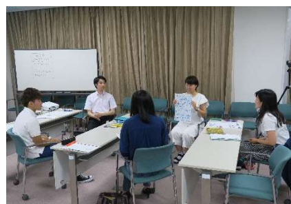
▲地域課題演習プロトタイプ版事前研修の様子

前期授業の「地域の課題 I (地域企業版)」を含め、それぞれの試行結果をもとにカリキュラムや講義運営を改善し、来年度以降の実質的な単位互換につなぎたいと考えています。後期授業はいずれも参観可能です。お気軽に事務局までお問い合わせ下さい。