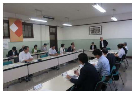
▲地域協働教育推進機構会議の様子