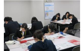
▲セミナーでグループワークに取り組む参加者