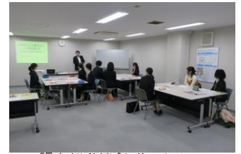
▲『志望動機』を作るためのセミナーの様子

『企業・業界・職種研究』セミナーURL http://miyagi-coc.jp/career/1678/