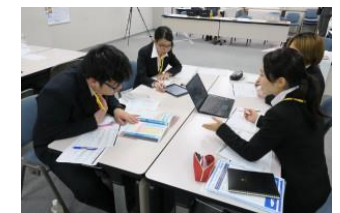
▲セミナーでの、業界誌、PC等を用いたグループワーク

平成29年度の事業計画に基づき、今後順次、部会を開催してまいります。直近の開催日程は裏面「今後の予定」をご参照ください。