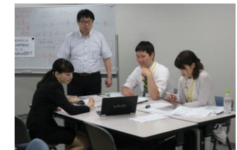
▲「企業・業界・職種研究」セミナーの様子