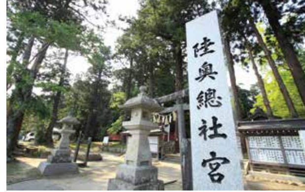
●陸奥総社宮 多賀城市市川字奏社 1 TEL.022-368-8065

多賀城東門の東側約150メートルの道路沿いにあります。延喜年間(901～922)、陸奥国にあった100の神社の祭神を合祀して創建されたと伝えられ、塩竈神社に参拝するには、先ず総社宮に詣でることとされています。現在の拜殿は享保19年(1734)に建てられたもの。背後に広がる鎮守の森の老杉は樹齢約600年。