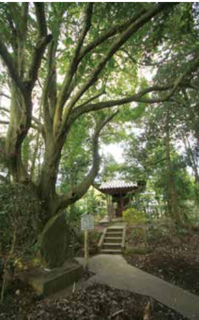
●貴船神社 多賀城市市川字金堀 旧塩竈街道に面した鬱蒼たる木々の中にあります。五穀豊穡、海上安全、大漁の神とされ、古くから大小の木の船が献納されてきました。覆堂の中の小祠が本殿であり、元禄6年(1694)に現在地に遷されたといわれています。覆堂を包み込むように枝葉を繁らせる榎の大木は樹齢470年。