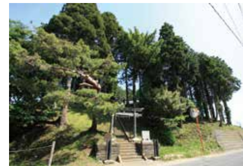
●浮島神社 多賀城市浮島 1-1-1

拜殿の縁に置かれた安産枕。安産を祈願する人が一ついただいで帰り、無事出産したら新しい枕を添えてお返しする習わしです。