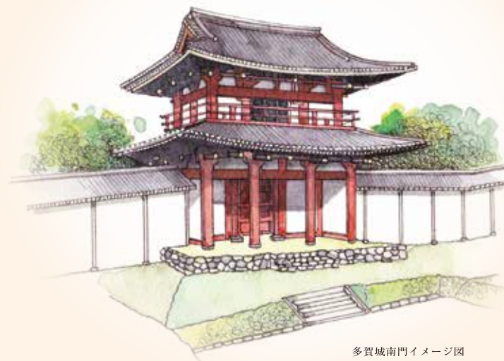
多賀城南門イメージ図

地域の歴史的魅力や特色を通じて我が国の文化・伝統を語るストーリーを文化庁が「日本遺産」として認定します。日本遺産「政宗が育んだ“伊達”な文化」の構成文化財が多賀城市内に5件あります。