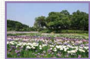
多賀城跡あやめ園