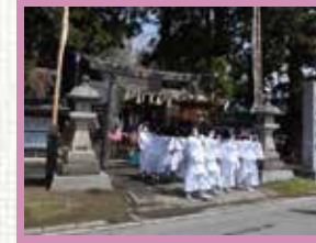
陸奥総社宮例大祭

いつ訪れても 風情ある風景に出会える 史都多賀城の四季折々の 表情をお楽しみください