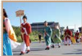
史都多賀城万葉まつり