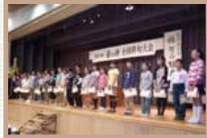
「壺の碑」全国俳句大会