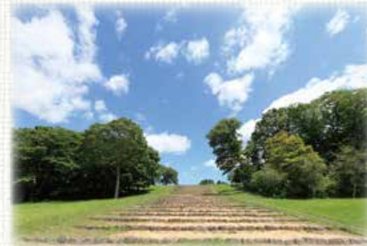
政庁一南門間道路