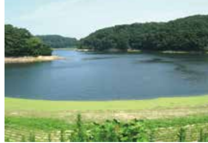
●加瀬沼 江戸時代、八幡の領主天童氏が造った人工のため池。春の桜、秋の紅葉の時期には多くの市民で賑わいます。農林水産省により、「ため池百選」に選定されています。