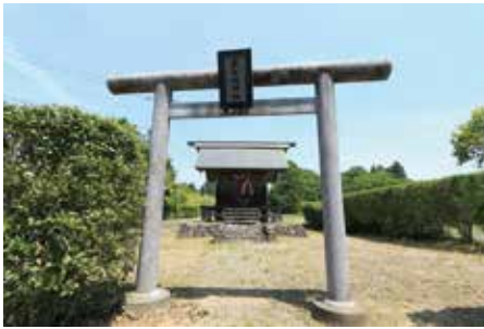
●多賀城神社 多賀城市市川字大畑 昭和27年多賀城政庁跡に創建された市内で最も新しい神社。即位前に陸奥の太守を務めた後村上天皇と、それに仕えた北畠親房・顕家父子らが祀られています。昭和48年政庁跡の整備に伴い現在地に遷されました。社殿は多賀城海軍工廠の奉安殿を移築したものです。