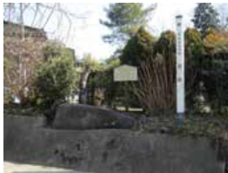
●伏石 多賀城市市川字坂下 弘安10年(1289)の年号が刻まれた鎌倉時代の板碑(供養碑)。玉川寺が政庁跡の南側にあった頃、住職が寺に連れて門前に立てたところ疫病がはやり、元どおり伏せて置いたという伝説があります。