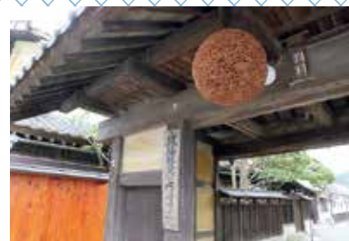
丁寧に手造りする「鳳陽」の味は、今も昔も変わらない。