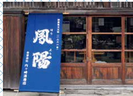
「鳳陽」の名には、家運隆盛の願いが込められている。