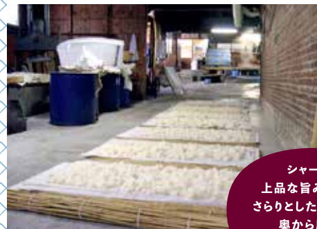
酒米を蒸す様子。「手造りの技」が脈々と受け継がれている。