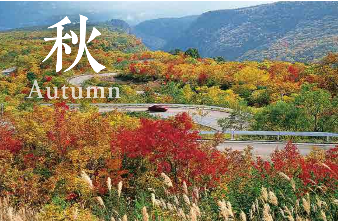
蔵王エコーライン