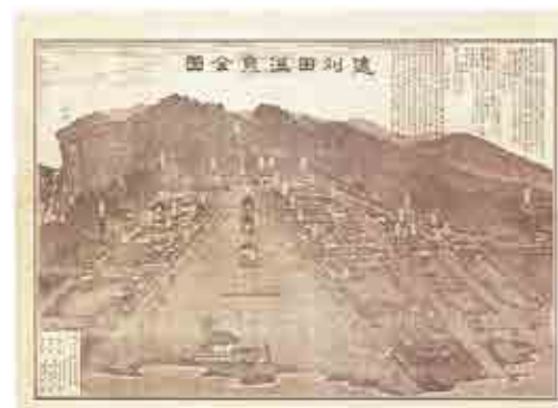
遠刈田温泉全景 (明治30年頃)

1601年に開湯された400年余りの歴史を持つ温泉地です。泉質は「ナトリウム」「カルシウム」「硫酸塩」等で、神経痛・筋肉痛・関節痛に効果があると評判で癖のないやさしさが特徴です。遠刈田温泉には旅館、ホテル、ペンション等の施設が約40件あるほか、温泉街の中心には、青森ヒバをふんだんに使用した共同浴場「神の湯」があり、その香りに包まれながら入浴することができます。外には「足湯」（無料）も併設されていますので、観光の目的に合わせて温泉を楽しむことができます。