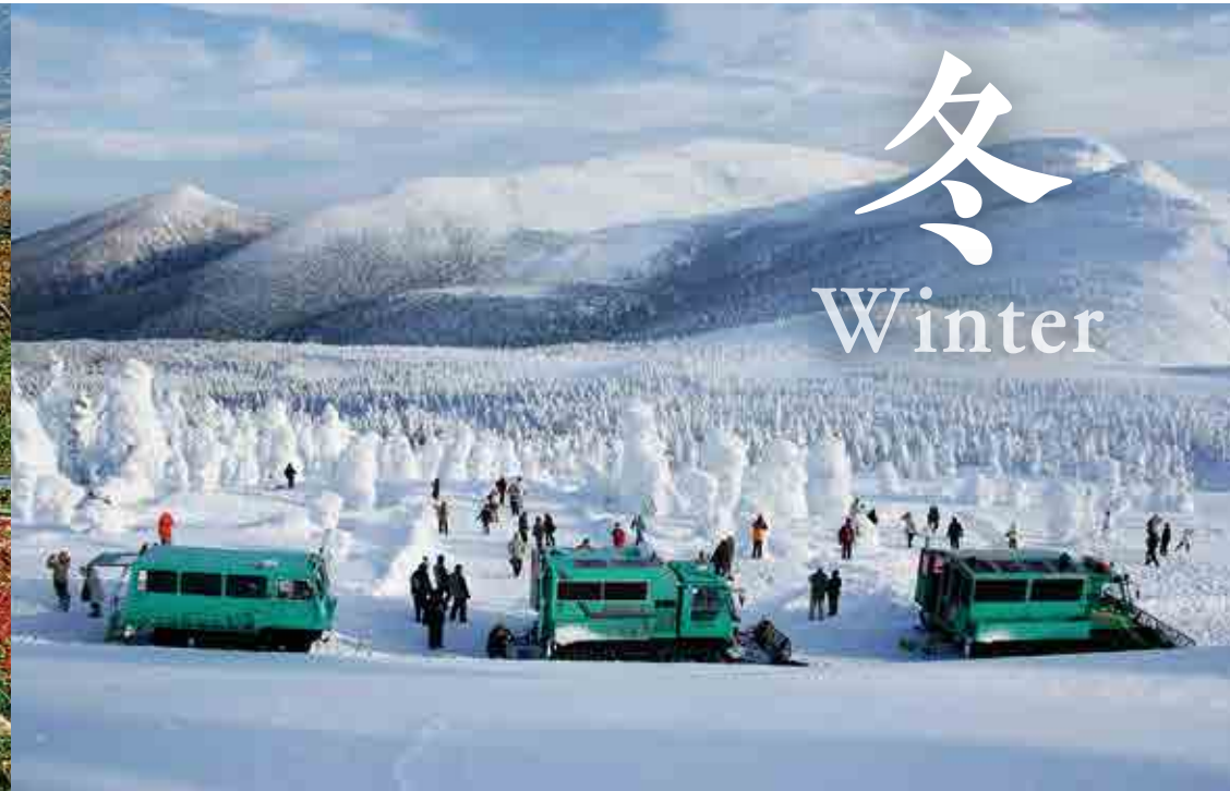
みやぎ蔵王スキー場すみかわスノーパーク樹氷鑑賞ツアー