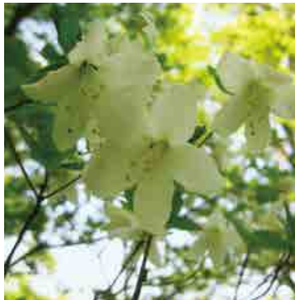
シロヤシオツツジ

みやぎ蔵王えぼしリゾートのスキーゲレンデでは、4月の大型連休前から5月下旬まで、30種類以上約50万株の『すいせん』が花を咲かせます。見渡す限り黄色の花で埋め尽くされるその景色は壮観です。また、5月下旬から6月上旬にかけては『シロヤシオツツジ（五葉つつじ）』の群生を楽しむことができます。