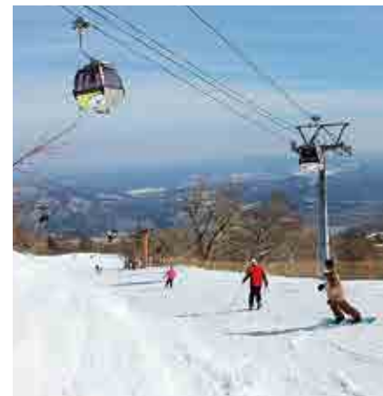
みやぎ蔵王えほしリゾート

宮城県内外からスキーやスノーボードを楽しむに、多くのお客さんが遊びに来ます。町内には、県内最大級の滑走施設を誇る『みやぎ蔵王えほしリゾート』と、本格的なスノーボードコースを整備している『すみかわスノーパーク』の2ヶ所のスキー場があります。