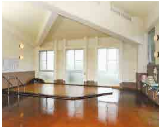
蔵王町老人憩いの家『白鳥荘』