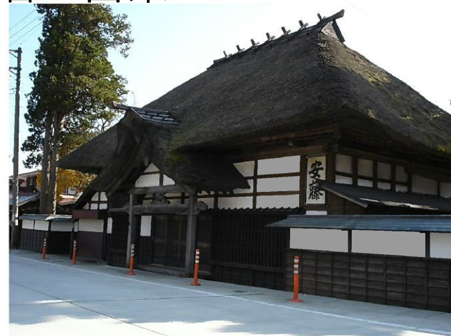
茅葺屋根が残る『安藤家本陣』

七ヶ宿街道は「日本の道100選(地域の人々にどれだけ親しまれた道路であるかが最大の選定基準で特色ある優れた道路)」に選ばれているよ