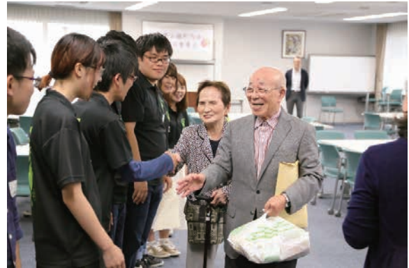
写真2 学生による握手での見送り

12月2日、土樋キャンパスホーイ記念館1階のコラトリエ・リエゾンにて「スマホサロン@青葉土樋」を開催した。本事業は文科省の地（知）の拠点整備事業の一環として本学地域共生推進機構が主催したもので、青葉土樋地域の方を対象に、スマホを通じた新たなコミュニケーションの手段や災害時に役立つ使い方