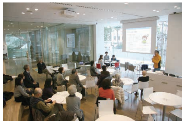
写真3 教養学部教授による導入の講義