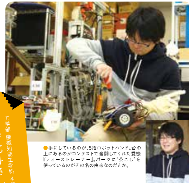
●手にしているのが、5指ロボットハンド。台の上にあるのがコンテストで奮闘してくれた愛機『ティーストレーナー』。パーツに“茶こし”を使っているのがその名の由来なのだそうです。