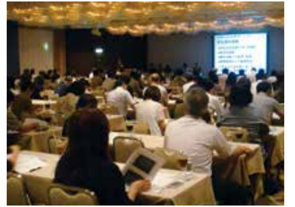
昨年度の山形会場の様子

地区後援会とは、7月~9月にかけて、北は札幌市から南は東京都までの全25地区に本学教職員が出向き、東北学院大学の近況のご報告や個別面談などを行うものです。5月の後援会総会の出席や欠席にかかわらず、どなたでもご参加いただけます。また、夏休み期間で帰省されているご子女とご一緒にご参加いただくこともできます。該当する地域の保護者の皆さまへの正式なご案内状の発送は、6月中旬を予定しております。多数の方々のお申し込みをお待ちしております。