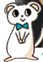
◀TGCキャラクター「るるじゅ」