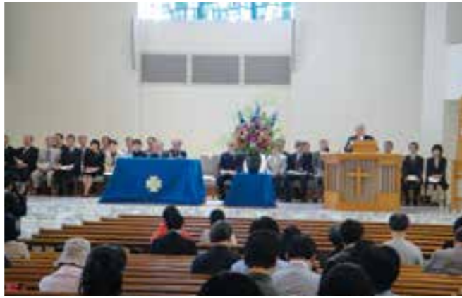
昨年度の総会の様子

本年も、新緑映える泉キャンパスを会場に、後援会総会を開催いたします。当日は、総会のほか、「学生の就職を考えるセミナー」や「学生と保護者のための教養セミナー」、「パイプオルガンコンサート」、「学科別懇談会」や「個別相談」などの大学開放プログラムを多数用意しております。この機会に、ご子女の学生生活の一端に触れていただければ幸いです。保護者の皆さまのご参加をお待ちしております。