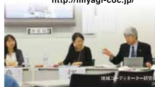
地域コーディネーター研究会