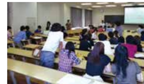
2015年度「震災と復興」授業の様子

▶みやぎ・せんだい協働教育基盤による地域高度人材の育成 http://miyagi-coc.jp/