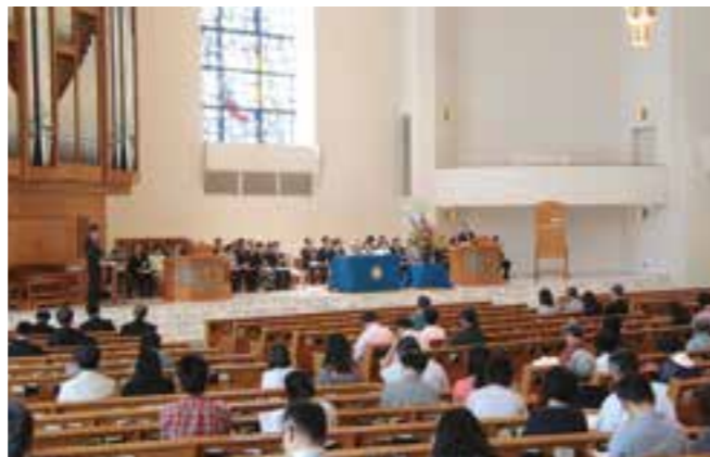
昨年度の総会の様子

本年も、新緑映える泉キャンパスを会場に、後援会総会を開催いたします。当日は、総会のほか、「学生の就職を考えるセミナー」や「保護者と学生のための教養セミナー」、「パイプオルガンコンサート」、「学科別懇談会」や「個別面談」などの大学開放プログラムを多数用意しております。この機会に、ご子女の学生生活の一端に触れていただければ幸いです。保護者の皆さまのご参加をお待ちしております。