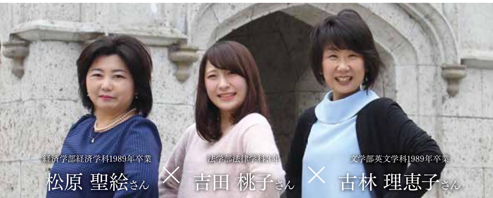
経済学部経済学科1989年卒業