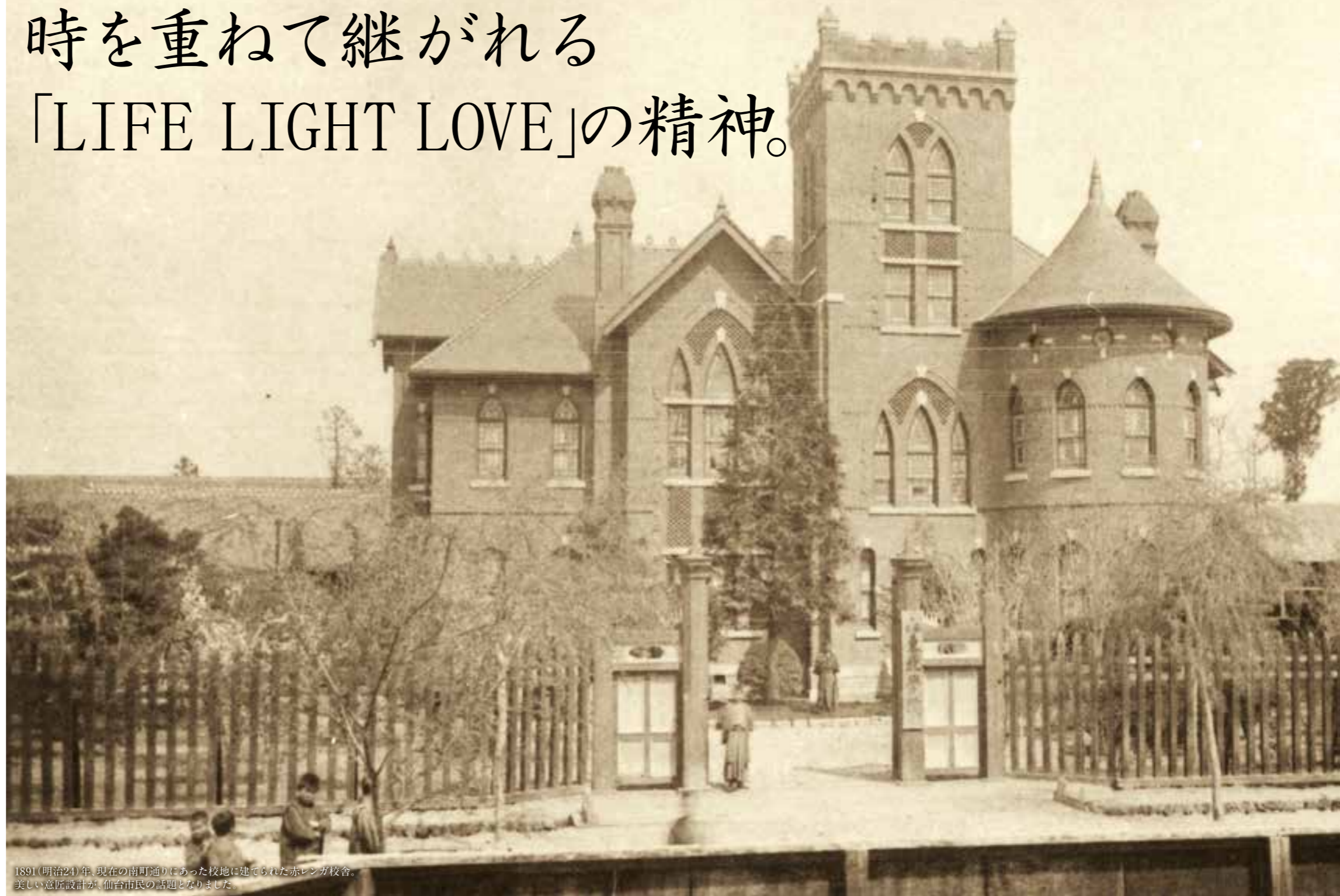
1891(明治24)年、現在の南町通りにあった校地に建てられた赤レンガ校舎。美しい意匠設計が、仙台市民の話題となりました。

幾多の困難—大火や地震などの災害、そして恐慌や戦争といった時代の嵐—に見舞われてもなお、次代を担う若き輝きを育成することを使命に、教育の理念を高く掲げてきた東北学院。今年、130年の歴史の節目を迎えることとなりました。第二代院長D・B・シュネーダーが唱えた建学の精神「LIFE LIGHT LOVE」は今も鮮やかに、学院スピリットとして受け継がれています。