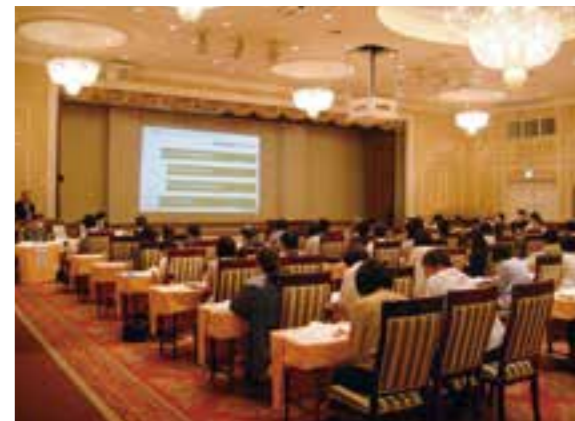
昨年度の大河原会場の様子

地区後援会とは、7月~9月にかけて、北は札幌市から南は東京都までの全28地区に本学教職員が出向き、東北学院大学の近況報告や個別面談などを行うものです。5月の後援会総会の出席や欠席にかかわらず、どなたでもご参加いただけます。また、夏休み期間で帰省されているご子女とご一緒にご参加いただくこともできます。該当する地域の保護者の皆さまへの正式なご案内状の発送は、6月中旬を予定しております。多数の方々のお申し込みをお待ちしております。