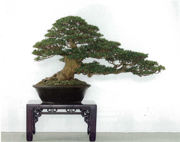
皐月（大盃） Rhododendron indicum ‘Osakazuki’ 60cm 大昭渡丸（南蛮） 宮城県仙台市 山本展雅 出典）写真は、山本展雅先生の作品。

『第91回 国風盆栽展』，(社) 日本盆栽協会 (2017年 5月)，350ページ所収（許可を得て掲載）。