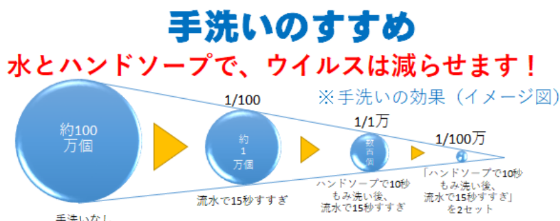
図 1. 手洗いのすすめ

まずは、密閉空間（換気の悪い密閉空間である）、密集場所（多くの人が密集している）、密接場面（互いに手を伸ばしたら届く距離での会話や共同行為が行われる）という 3 つの条件（「3 つの密」）を避けることが重要で、さらに「身体的距離の確保」、「マスクの着用（咳エチケットの励行）」及び「手洗いなどの手指衛生（石けんによる手洗いや手指消毒用アルコールによる消毒）」（図 1）をはじめとした基本的感染症対策を継続する必要がある。手や指についたウイルスは流水による 15 秒の手洗いだけで 1/100 に、石けんやハンドソープでもみ洗いし、流水で 15 秒すすぐと 1 万分の 1 に減らせる。このように「新しい生活様式」の確実な実践によって、感染拡大を予防していくことが重要となる（図 2）。